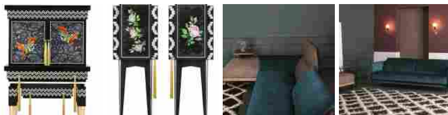
GALLERIA DI IMMAGINI: SALONE DEL MOBILE 2017, FOTO

Design, tendenze 2018 e idee di arredamento per rinnovare casa all'insegna del buon gusto grazie alle tante novità presentate durante il Salone del Mobile 2017 : ecco cosa ci ha colpito di più tra le tante esposizioni presenti a Fiera Milano.